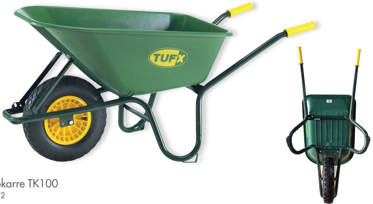
TUFx Schubkarre TK100 Art.-Nr. 70 26 22